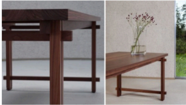
ØDE-tafel: De Stijl.

ØDE mag dan nog een jong label zijn, maar toch beschikt het bedrijf over eeuwenoude kennis. Rolf is namelijk ook eigenaar van Timmerfabriek J. van de Plas. Hij is de 8e generatie die in Brabant sinds 1754 de timmermanshamer hanteert. In deze specialistische restauratiebranche worden vaak speciale verbindingstechnieken gebruikt. "We zijn ons gaan afvragen of we dit vakmanschap ook toe konden passen op een meubelstuk. De tafels moesten verbonden zijn met de fabriek; als het ware een verlengstuk van de ambacht."