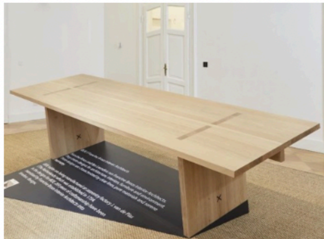
De ØDE-tafel Otoko die schitterde in Milaan.